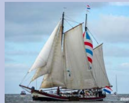
Zweimast-Klipper Boekanier, gebaut 1901

Wer kommt mit? Wir fahren in den ersten zwei Wochen der Sommerferien 2023 in die Niederlande zum Segeln. Gemeinsam segeln ist toll! Wir werden