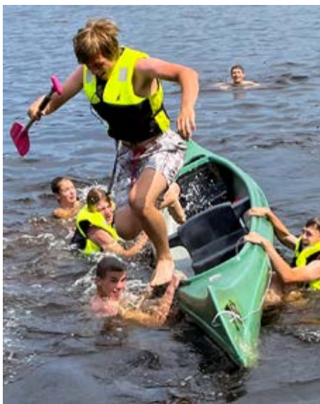
Manchmal kann man sich nur mit einem Sprung ins Wasser retten

(Fast) mückenfreie Lagerfeuerromantik bei der Jugendfreizeit