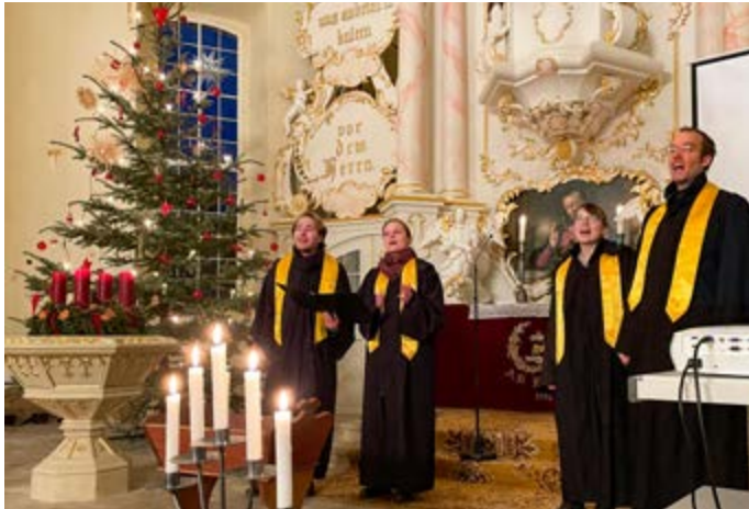
Gospelquartett in der Kirche Büßleben

Der 1. Advent steht ganz im Zeichen der Musik. Wir werden im Gottesdienst schöne Adventslieder singen und uns damit auf das Weihnachtsfest einstimmen. Dazu werden uns vier junge Musiker der Musikhochschule Weimar mit Gospels erfreuen.