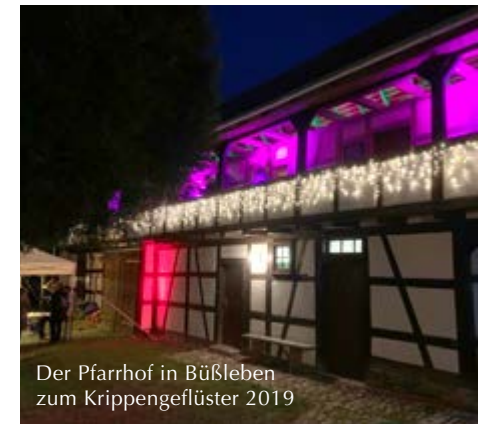
Der Pfarrhof in Büßleben zum Krippengeflüster 2019

Mit einer Bläser-Andacht eröffnen wir den Nachmittag auf dem Pfarrhof, Am Peterbach 3 in Büßleben. U. Edom