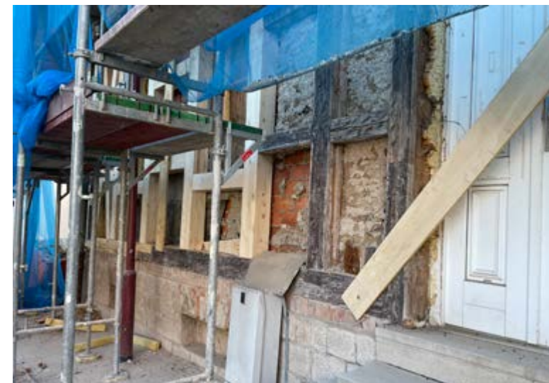
Neue Balken für die Nordfassade des Kindergartens Büßleben

Manchmal geschehen doch noch Zeichen und Wunder. Jahrelang haben wir uns darum bemüht, die bauliche Situation am Altgebäude unseres Kindergartens in