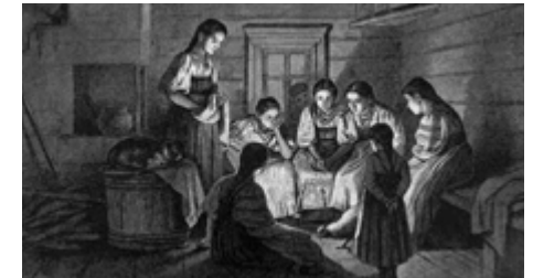
Russische Illustration von 1885 zu einer Versammlung in den Rauhnächten

Von Herzen freundlich ist Gott, ein Licht aus der Höhe wird uns besuchen, wie die Sonne am Morgen aufstrahlt, und wird uns allen erscheinen in Finsternis und Schatten des Todes. Er wird unsere Füße lenken und der Friede wird über unseren Schritten sein.