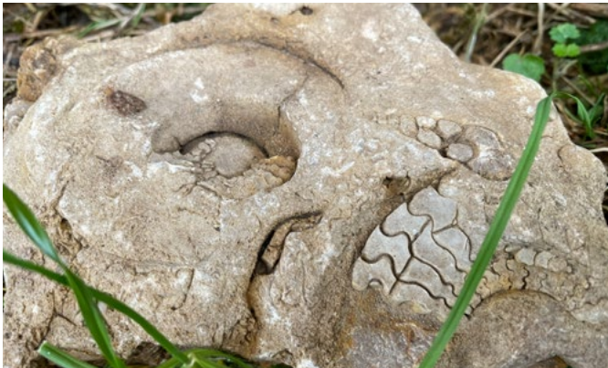
Versteinerte Ammoniten (Kopffüßler) an der Kirche Niedernissa abgelegt

Arbeiten am Kirchturm zutage getreten wären. Doch die Bauarbeiter verneinten, sie hätten damit nichts zu tun. Also haben wir vier große Kisten gefüllt, mit den verschiedensten Ammoniten (Kopffüßler), Muscheln und anderen Versteinerungen. Als Nächstes entdeckte ich viele Fossilien an der Kirche und um die große