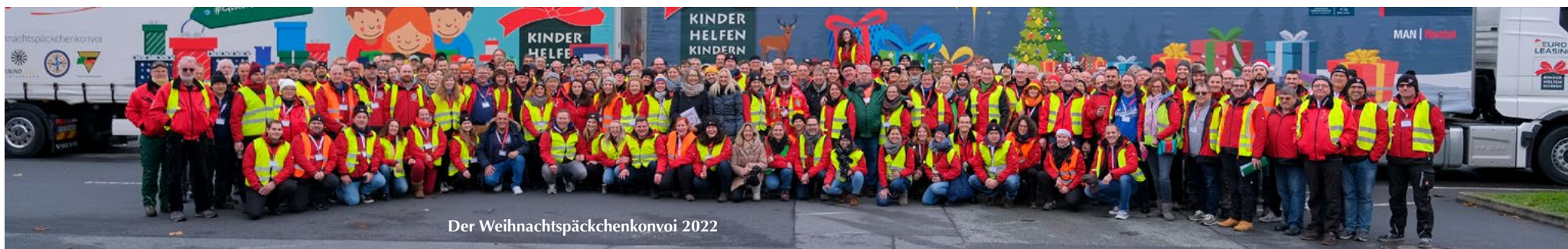
Der Weihnachtspäckchenkonvoi 2022