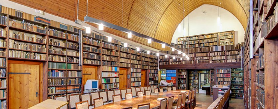
Bibliothek des Ev. Ministerium im Augustinerkloster