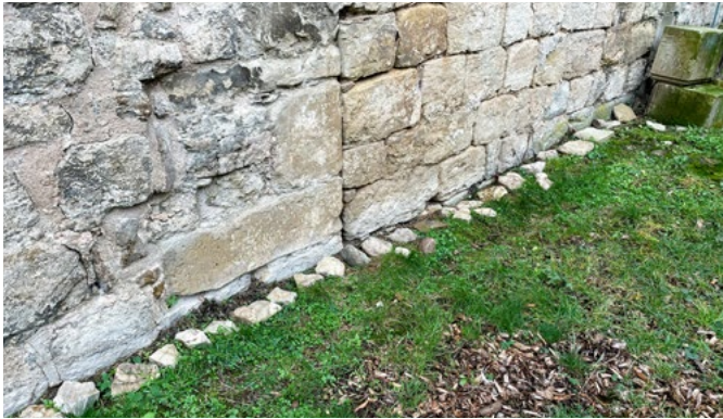
Eine Reihe von Versteinerungen am Kirchturm Niedernissa

Als die Sanierungsarbeiten am Kirchturm in Windischholzhausen in vollem Gange waren, fand ich an und um die Kirche zahlreiche Steine, die Fossilien enthielten. Zunächst war meine Vermutung, dass diese Schätze bei den