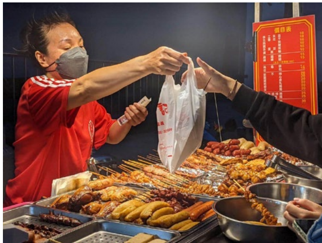
Nachtmarkt: Eine Verkäuferin überreicht der Kundin ihre Grillspieße.

In diesen unsicheren Zeiten haben taiwanische Christinnen Gebete, Lieder und Texte für den Weltgebetstag 2023 verfasst. Am Freitag,