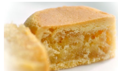
Taiwanesischer Pineapple Cake

derzucker schaumig rühren. Mehl mit Backpulver und Milchpulver vermischen. Das Ei unter die Buttermischung rühren und dann nach und nach die Mehlmischung dazu geben. In 9 Portionen zerteilen und zu Bällen formen. Eine Kuhle in die Mitte drücken. In diese die Ananasfüllung geben und den Teig darum formen. Den Backofen auf 160 Grad vorheizen. Die Ananaskuchen auf ein Backblech geben und 10 min backen. Dann wenden und weitere 5-7min backen. Nach dem Backen abkühlen lassen.